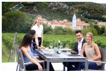
Die Flößerei BRANDNER in Rossatz