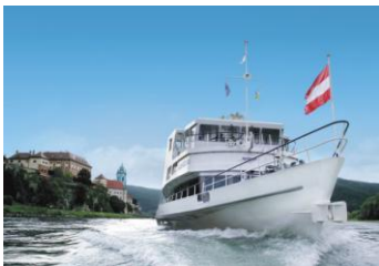
MS Austria vor Dürnstein

Originelle Pakete wie „Frühstück im Weingarten“, „Die Flößer.Liebelei“ und „Der Schorsch.Onkel“ kombinieren jeweils die Schifffahrt mit der MS Austria von Krems bis Rossatz, den Spazierweg zur Flößerei, eine pikant/süße Jause im Lokal, die Überfahrt nach Dürnstein und die Retourfahrt mit dem Schiff nach Krems.